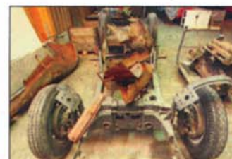
Das freigelegte Chassis des „Sturm“.

Steht wunderschön restauriert im Zeithaus der Autostadt Wolfsburg: der legendäre Kommissbrot.